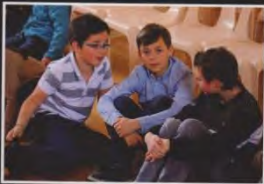
Être jeune en Morvan

Paul Cornu Les Rogations Ruisselle Sous les étoiles Pêche en Irlande