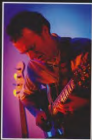
Jazz en Morvan