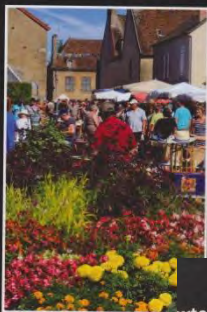
Corbigny : la ville aux 3 corbeilles Texte : VALÉRIE BERNADAT